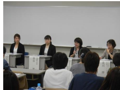
シンポジウムの様子